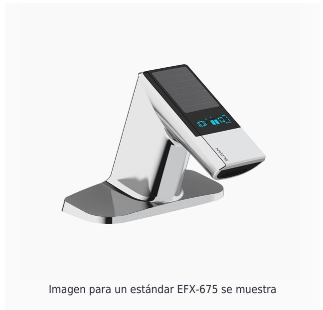
Imagen para un estándar EFX-675 se muestra

Encontrar un lavabo compatible para esta llave.